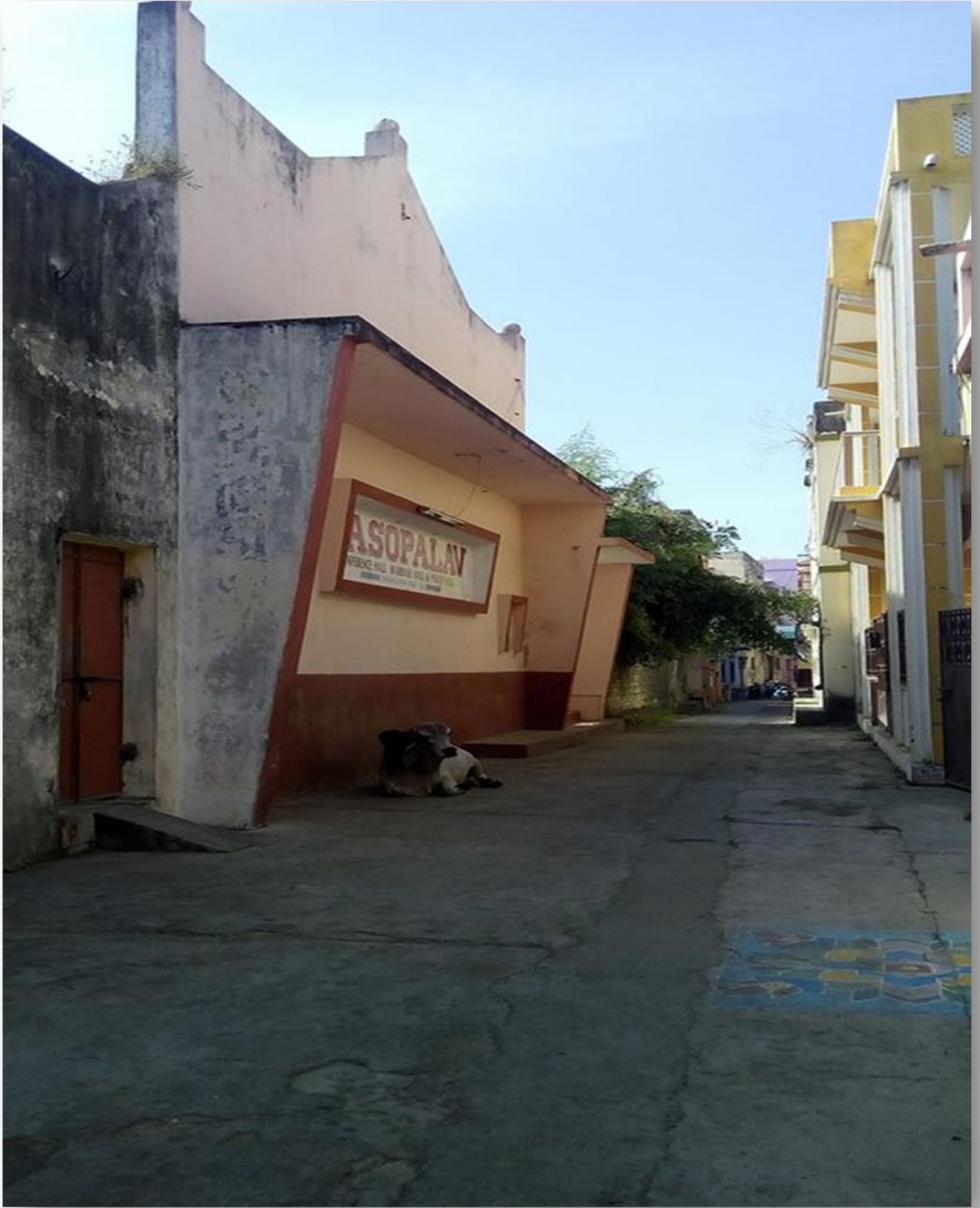
જૈન અપાસરો.