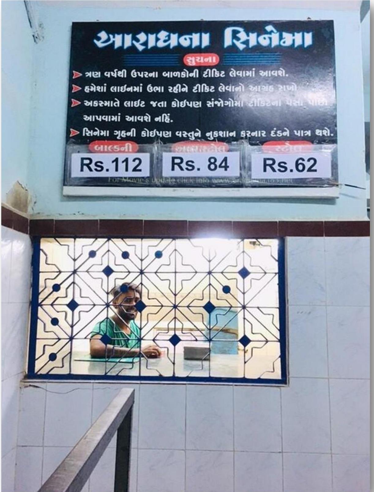
આરાધના સિનેમાની ટિકિટ ઓફિસ.