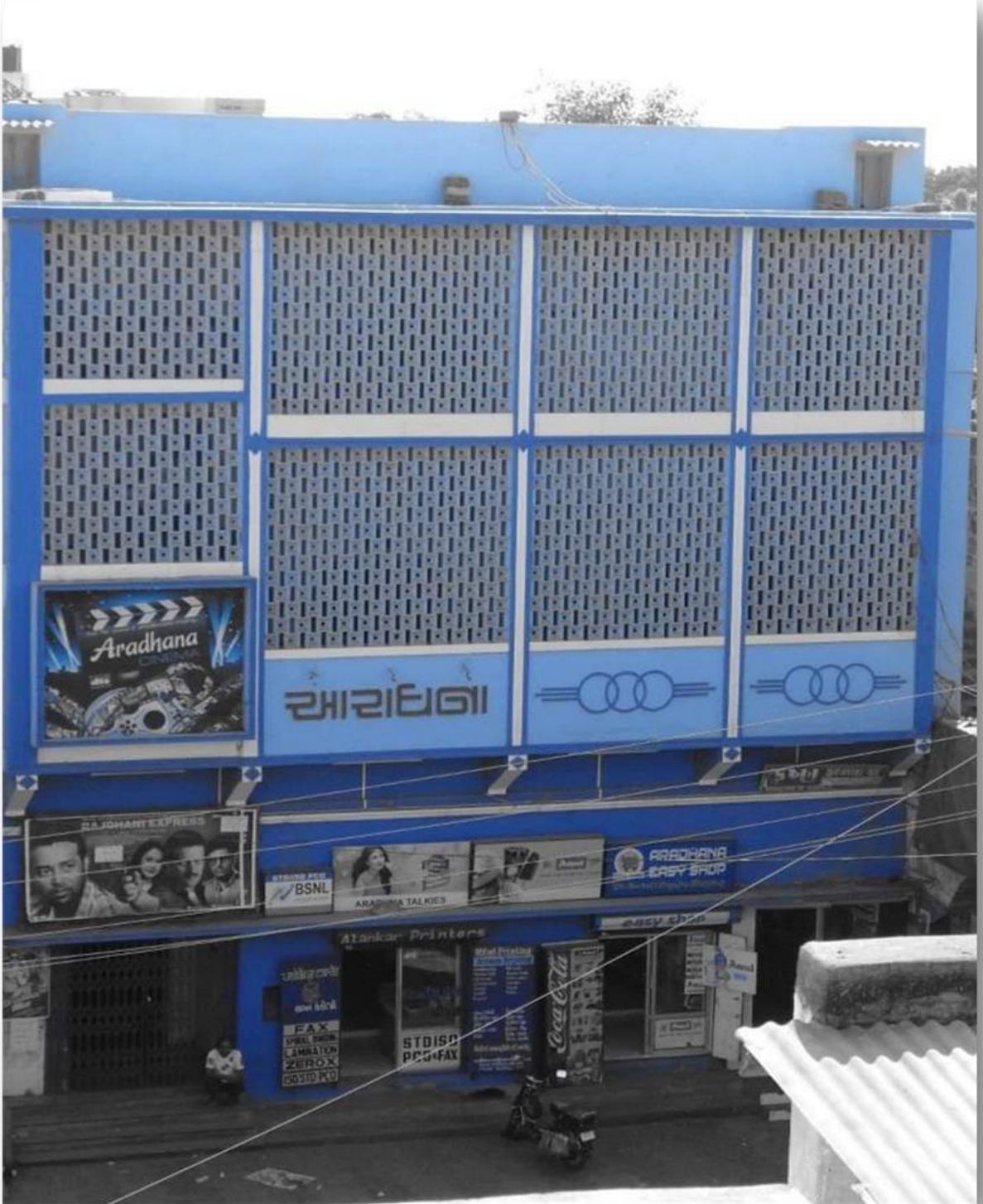
આરાધના સિનેમાની ઇમારત.