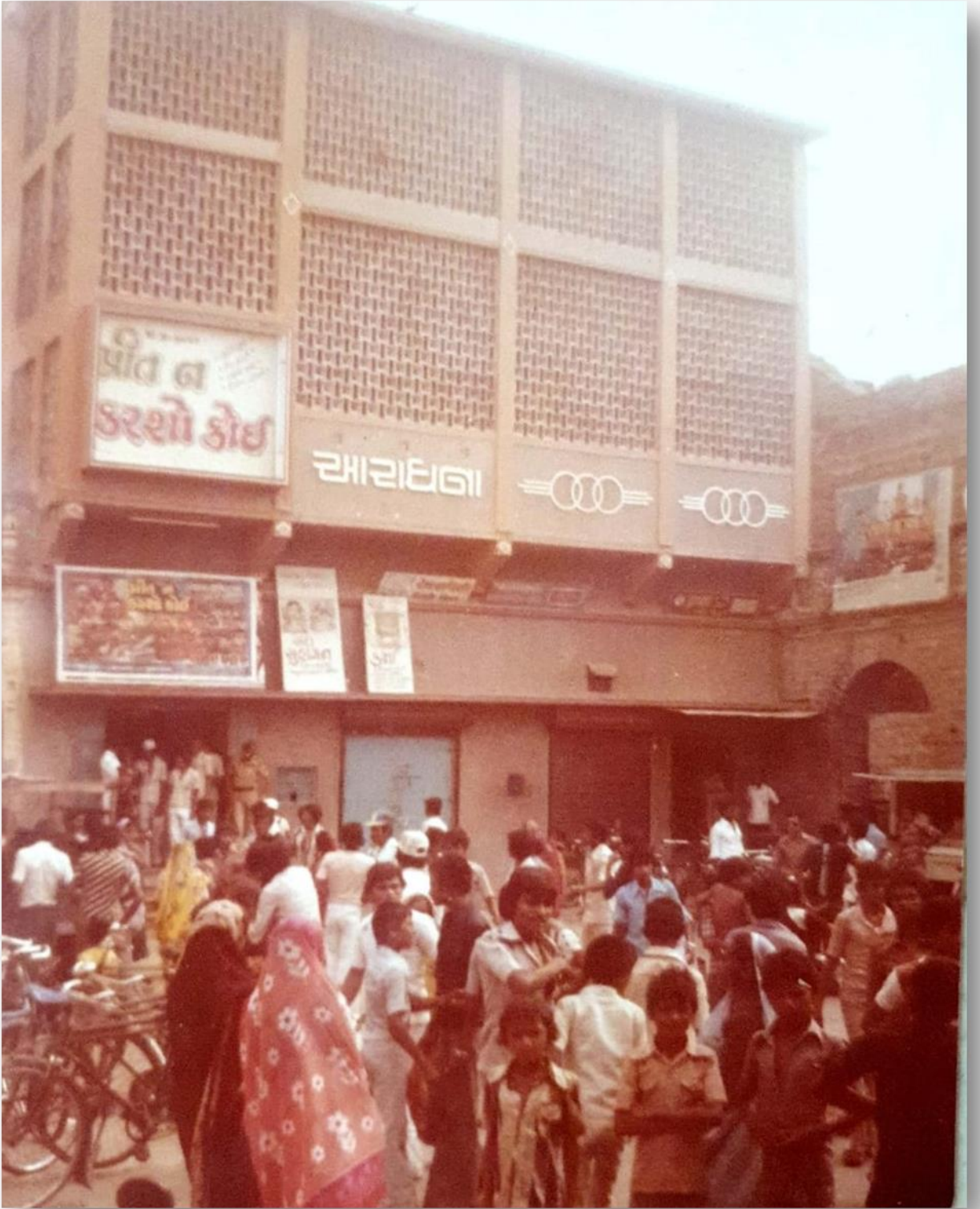
આ તસવીરમાં આરાધના સિનેમાની બહાર લોકોની થતી આવજા જોવા મળે છે.